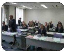
熱心に講習を受ける理事

この定時総会は、公益社団法人の構成員である会員の皆様、事業の実施状況、決算、財産状況を確認いただき、新年度の計画や予算を報告する年に一度のすべての会員が直接参加できる最重要な会議になります。基本は、全員参加が原則ですが、就業等でどうしても出席出来ない場合は、必